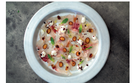
Carpaccio de daurade