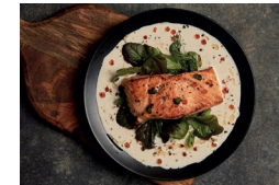
Pavé de saumon